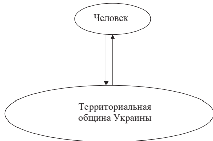
Рис. 3. Схема механизмов нового публичного управления Украины

община – регион – территориальная община Украины». С модернизацией тех, что уже наработаны, а именно: «человек – объединенная территориальная община»; «человек – регион»; «объединенная территориальная община – регион» и другие.